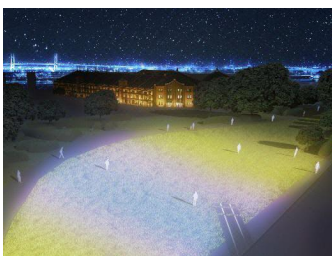
▲新港中央広場「つながる光の芝生」

【開催場所】横浜都心臨海部(横浜~桜木町・みなとみらい~野毛・伊勢佐木町~関内・石川町~山下・中華街・元町周辺ほか)