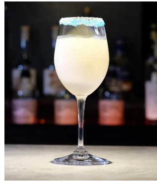
Daisy/「the twinkle of YOKOHAMA illumination ～煌めく横浜イルミネーション～」