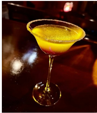
TWIN SOUL/「Healing effects(ヒーリング エフェクト)」

詳しくは、HPをご確認ください( https://cocktail.yokohama/ )