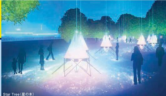
Star Tree (星の木)