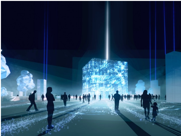
新港中央広場のプロジェクションマッピング