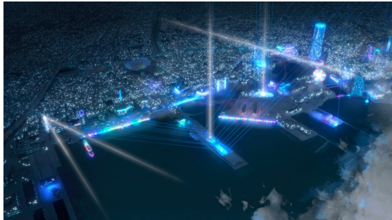
街全体の光の演出